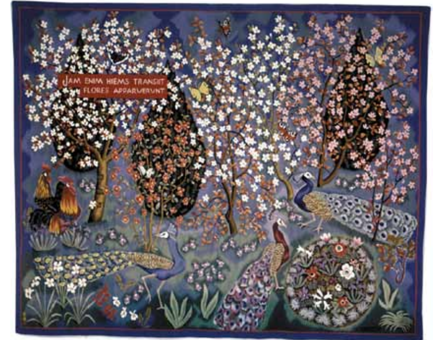
Le Printemps (260x330), carton de 1942, atelier Tabard, Aubusson.

Entrée Libre Office du Tourisme de Dourgne: 05 63 74 27 19