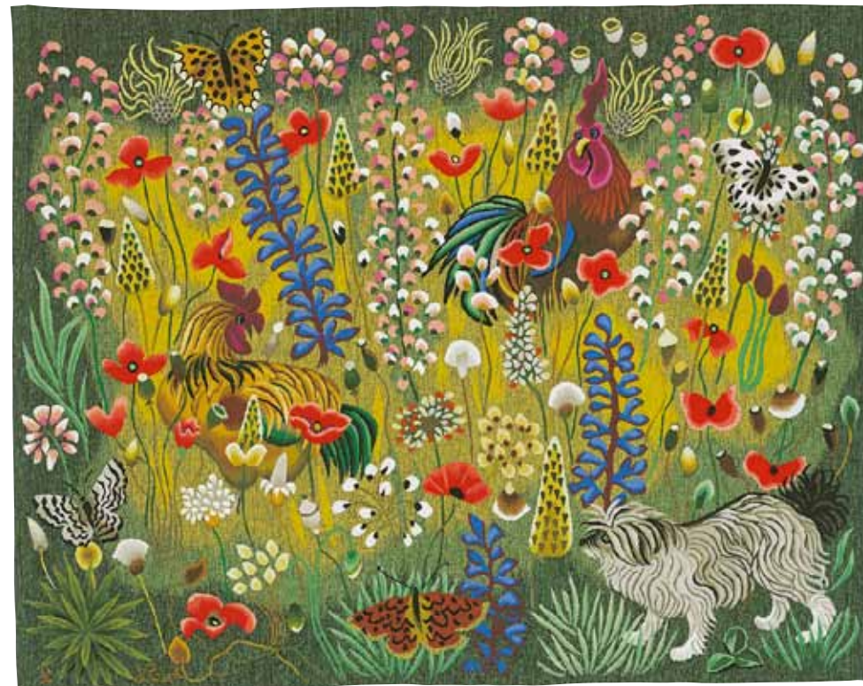
Vasca (170x215), carton de 1978, atelier Goubely, Aubusson.

À cette occasion, la Sodec (Abbaye d'en Calcat) publiera en collaboration avec les Éditions Privat un petit ouvrage thématique, premier d'une série sur Dom Robert.