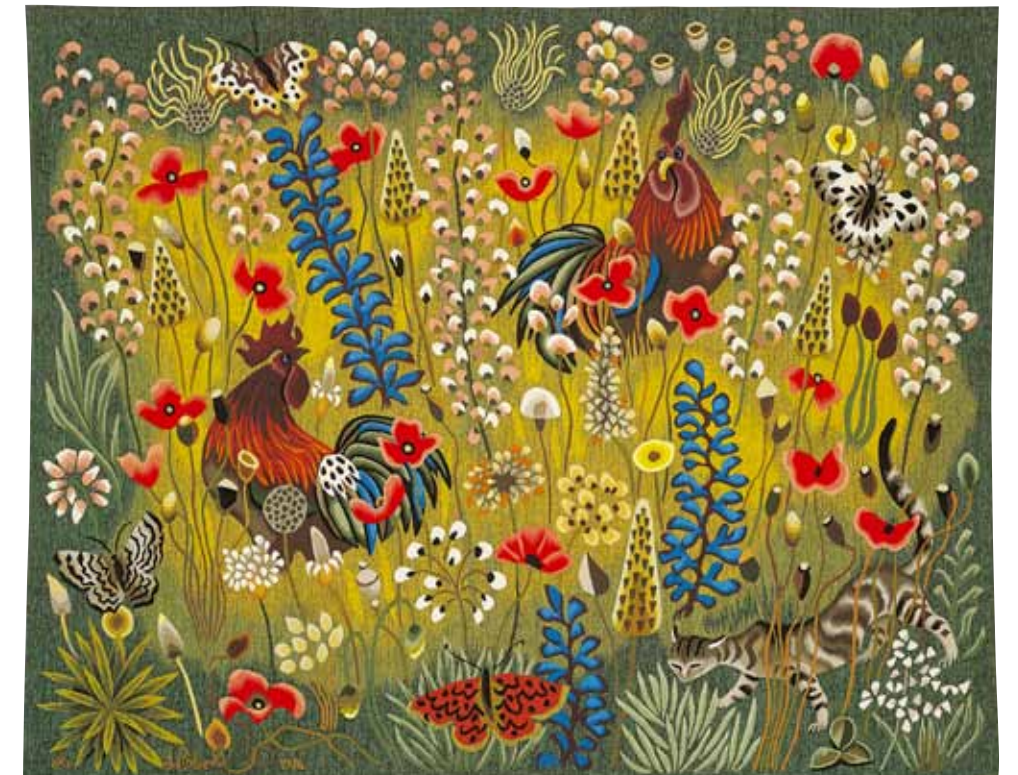
Une de mai (170x215), carton de 1974, atelier Goubely, Aubusson.